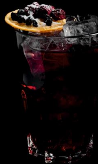
Vermouth with juice

Сладкий голубой коктейль на основе водки, спрайт и сиропа блю кюрасао.